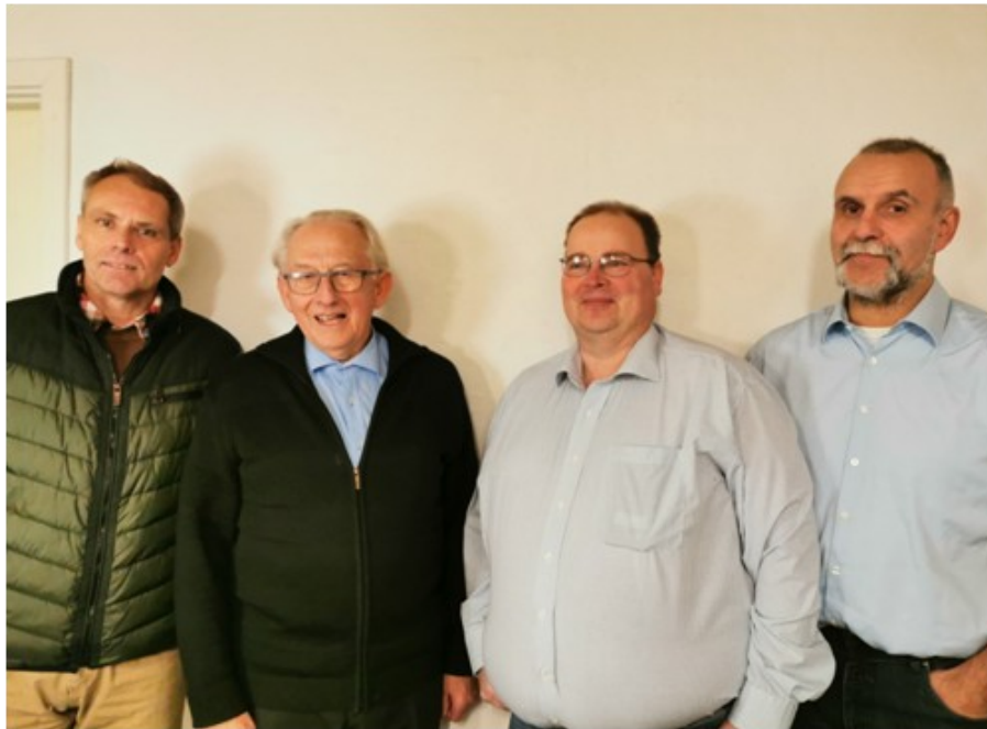
Medlemmer af bestyrelsen i Lindved:

Dette er nogle af grundene til, at Lindved og Øster Snede vælgerforening er nomineret til DM”